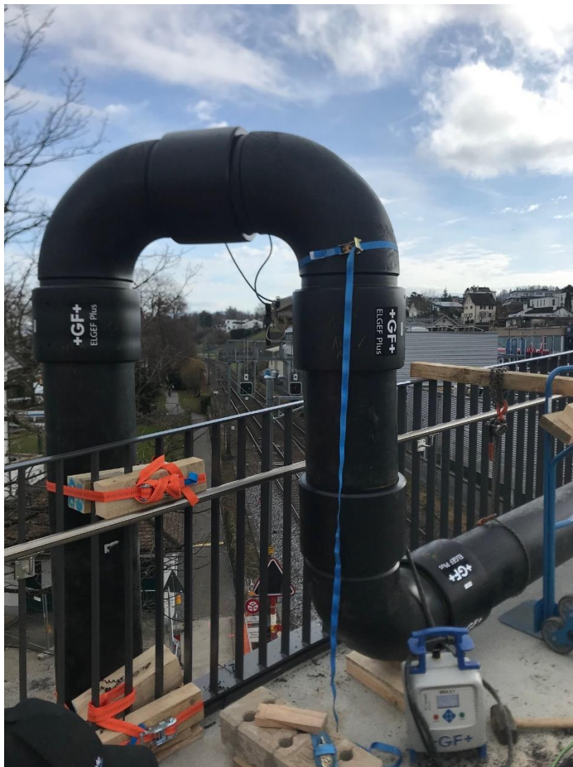
Temporäre Notleitung infolge Rohrbruch bei Querung Bahntrasse