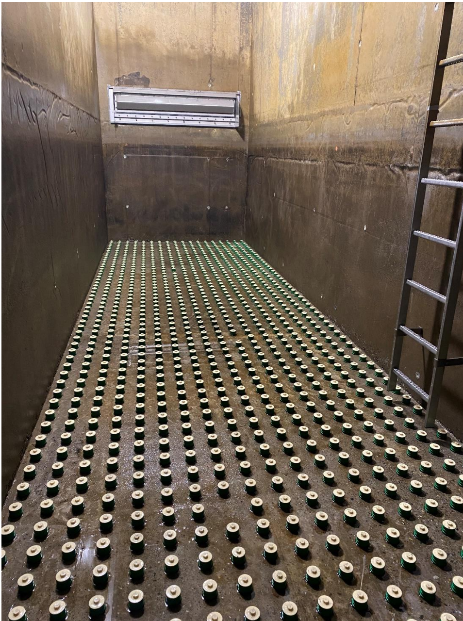
ungefüllter Aktivkohlenfilter während der Revision